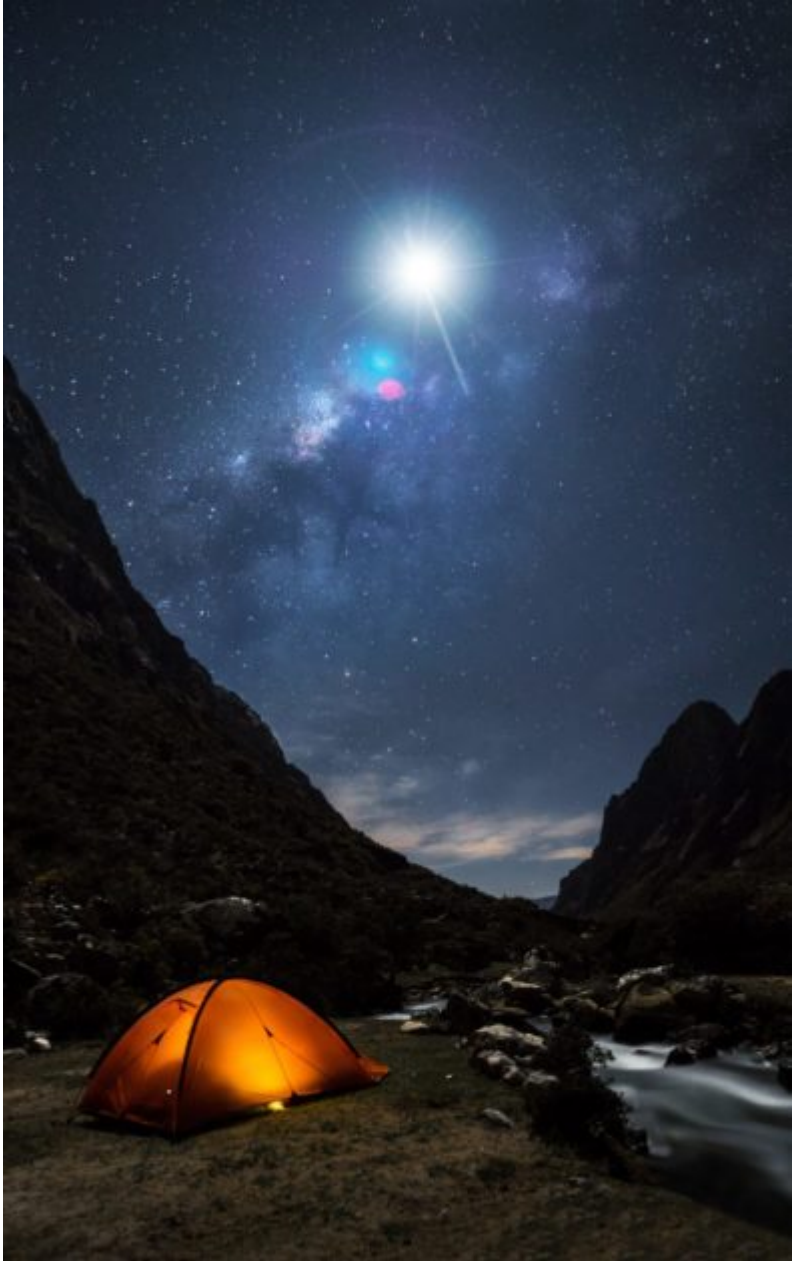
Million star hotel