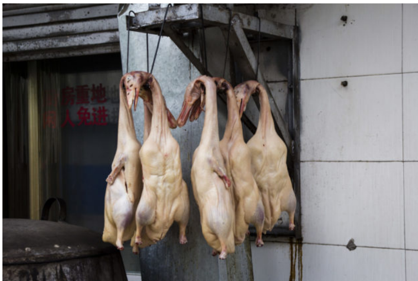
Kachna je v Číně oblíbená

Zábavný je zvyk Číňanů na vás téměř křičet v domnění, že jim pak budete lépe rozumět. První dojem z tety, u které jsem zakotvil na nudlovou polívku k snídani, byl v duchu „kašli na hlad a zdrhej!“ Nakonec se z ní vyklubala extrémně milá paní, která to se mnou myslela docela dobře a dokonce mi sama nabídla doplnění vody. Jen její lekce, k čemu jsou jaké nudle dobré, by bez problému zapadla do libovolného válečného filmu.