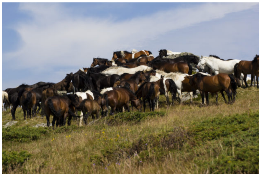
Koně se prakticky nebáli

pamětní deskou zasazený do mýtiny uprostřed lesa na odlehlém a minimálně navštěvovaném hřebeni hor a nebo značka, která zde začínala a mířila do nevábne směsi vysokého maliní a kopřiv. Tak či tak její objev pro nás znamenal usnadnění orientace, přestože rozhodně ne usnadnění pohybu.