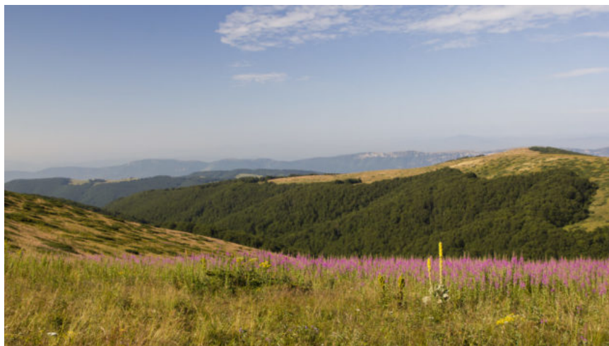
Pohled na oblé kopečky